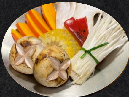
모듬 야채 추가 (단호박 포함)

Spicy stew with well-a Scharfer Eintopf mit