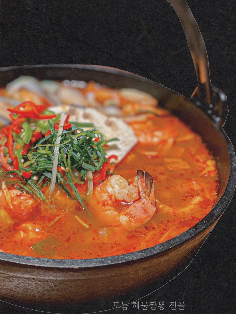
모듬 해물짬뽕 전골